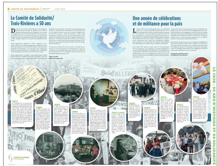
LE CS3R : 50 ANS D'HISTOIRE ET DE SOLIDARITÉ

La collaboration avec La Gazette de la Mauricie se poursuit également dans la réalisation de cahiers thématiques spéciaux. Cette année deux cahiers spéciaux ont été réalisés. Le premier, publié au mois de mai 2023, portait sur les enjeux de la biodiversité à l'échelle mondiale et le second, publié en novembre 2023, portait sur la souveraineté alimentaire.